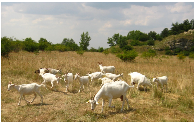
Obr.2: Obnova tradičnej pastvy na Devínskej Kobyle dnes