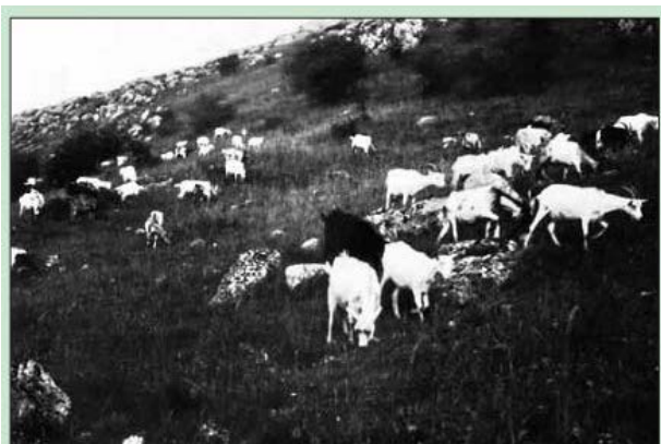
Pastva na juhozápadnom svahu Devínskej Kobyle v 30-tych rokoch 20. storočia